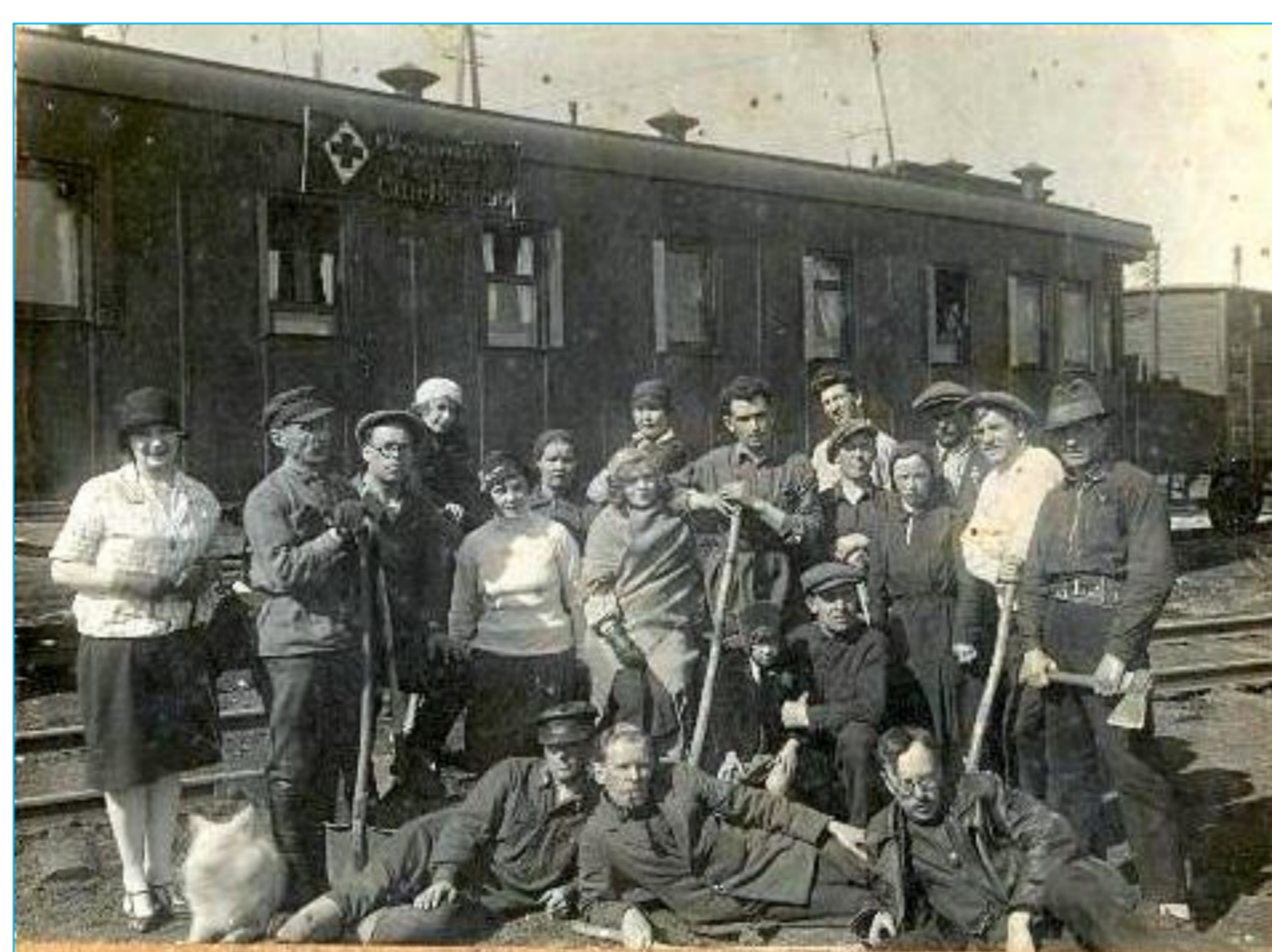
Выезд Театра санитарного просвещения